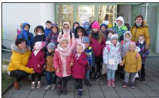
Kolektiv pracovnic Základní a mateřské školy

Na závěr nám dovolte, abychom Vám všem popřáli krásné a požehnané Vánoce a mnoho zdraví a štěstí v nadcházejícím roce 2022!